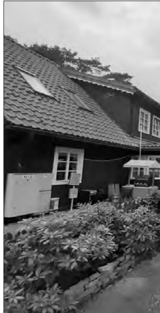
Селище Ніда дихає історією

Ще кілька фактів. У цій балтійській республіці в жовтні 1988 року було організовано Українське товариство. Громада допомагала новоствореній Українській державі. Особливо активно — під час Євромайдану, Революції Гідності та російської агресії в Україні від 2014 року. Литва на той час уже була членом Євросоюзу.