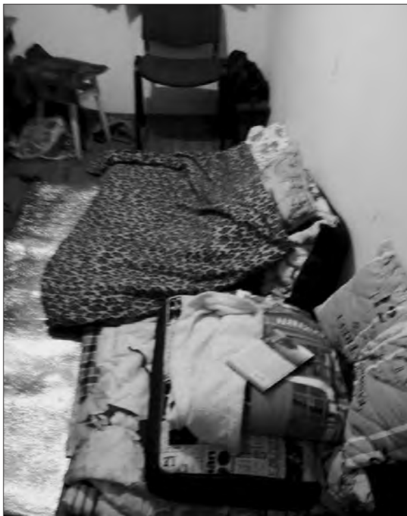
Місцеві жителі облаштували як укриття підвал.

І насправді, у кожного своя історія про пошуки укриття. Я перші два місяці війни просто бігала з 4-го поверху з ноутбуком та рюкзаком до підвалу свого будинку. Там працювала, іноді засинала, боялася, жила... Хтось просто не міг де-