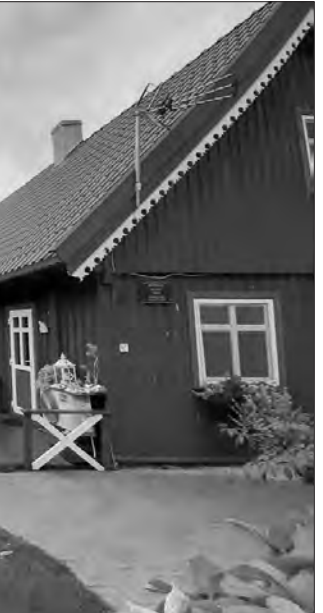
Селище Ніда дихає історією

Повноважний Посол Литовської Республіки в Україні Вальдемарас Сарапінас. Разом із головою ОВА обговорили аспекти облаштування шелтерів для внутрішньо переміщених осіб, будівництва постійного житла для них. Домовилися і про співпрацю в медичній сфері.