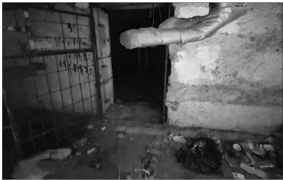
Такий сьогодні має вигляд сховище по вулиці Океанівській, 38-а.